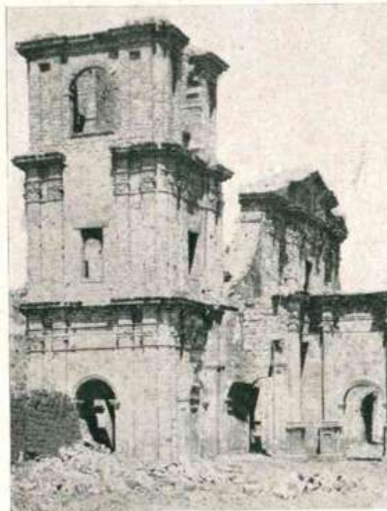
São Miguel. — Ruínas das torres da Igreja.