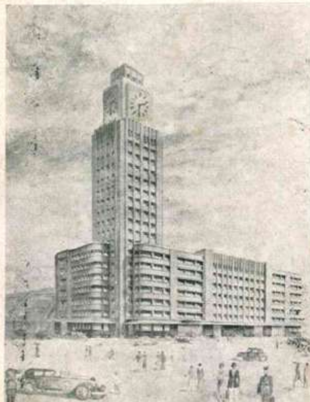
A estação Dom Pedro II, no Rio de Janeiro