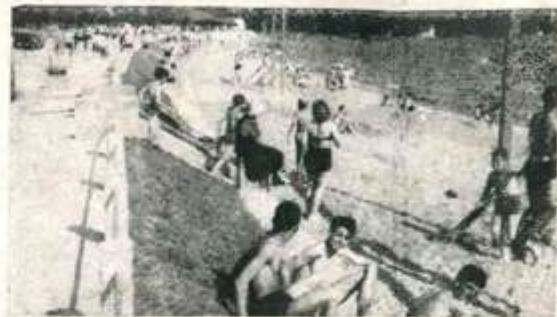
Outro aspecto da Praia da Assunção, o lindo balneário do Guaíba, preferido pela sociedade metropolitana.

O BANCO REALIZA TODAS AS OPERAÇÕES BANCARIAS.