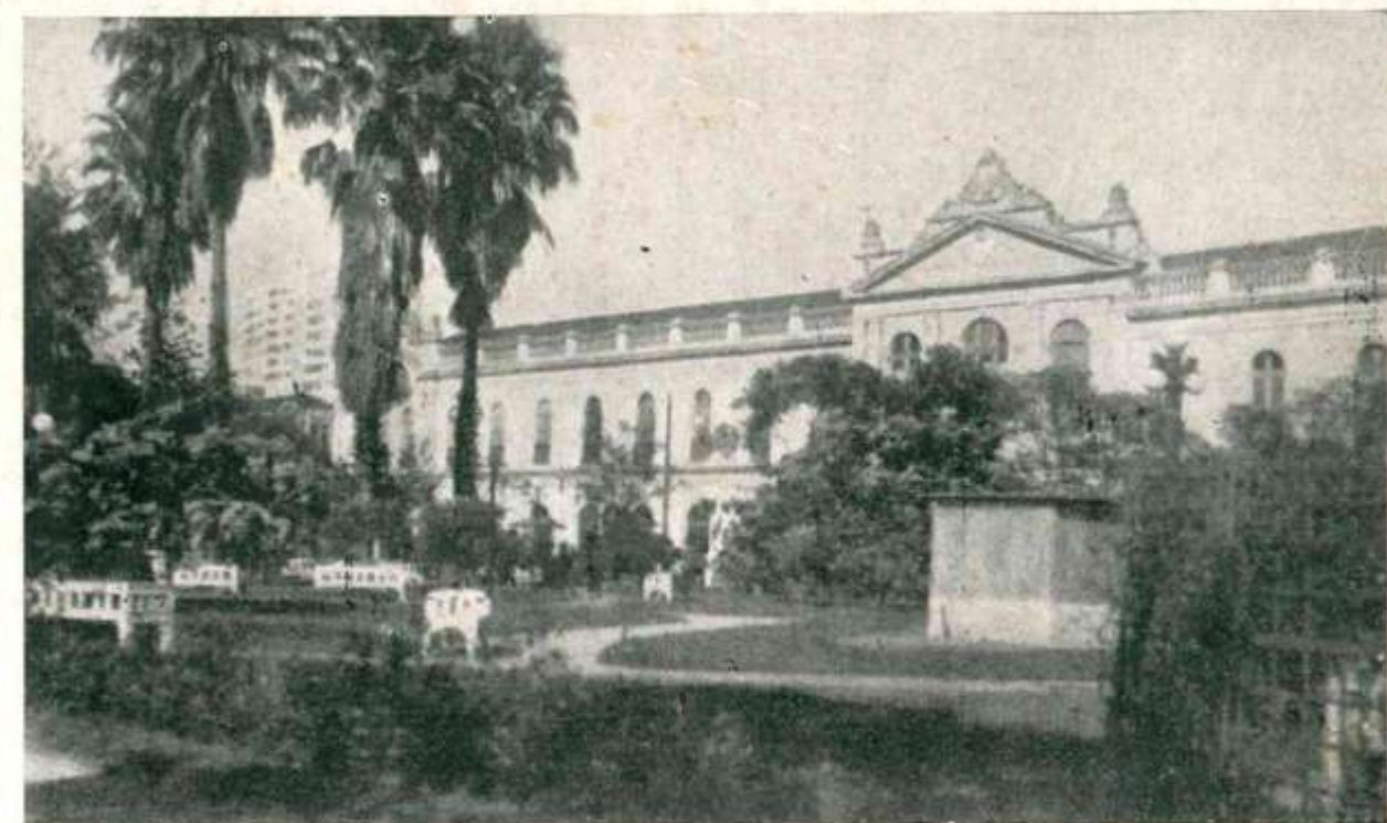
Mercado Público Municipal.