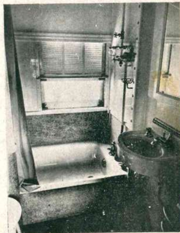
Gabinete de toilette de carro dormitorio tipo Pullman.