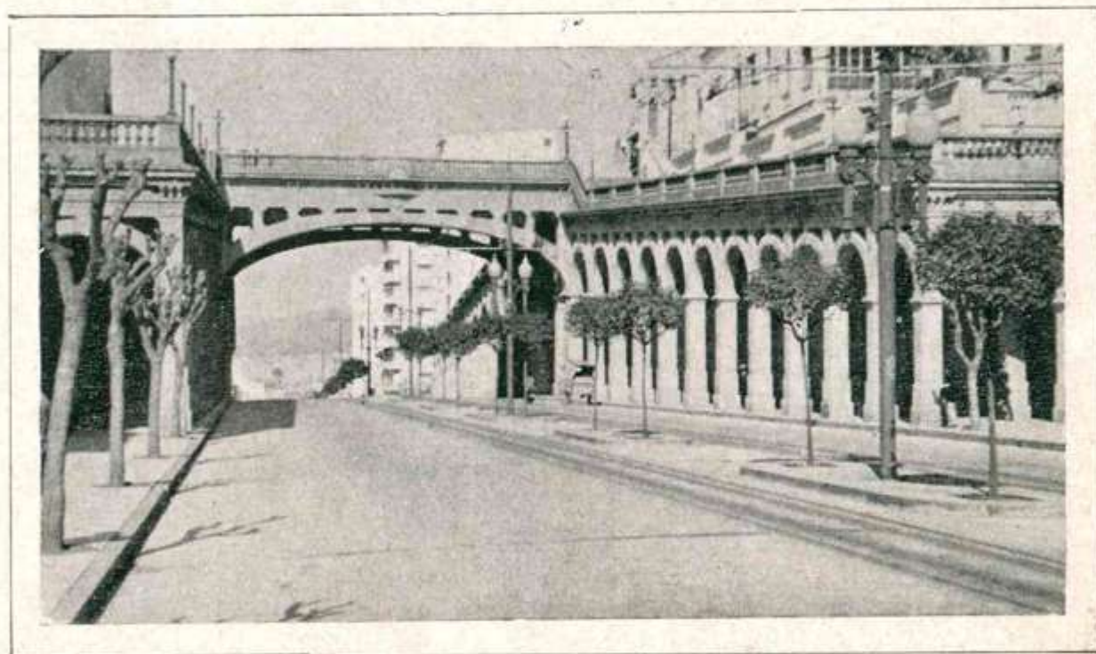
Viaduto Borges de Medeiros, magnífica obra urbanística da capital gaúcha.