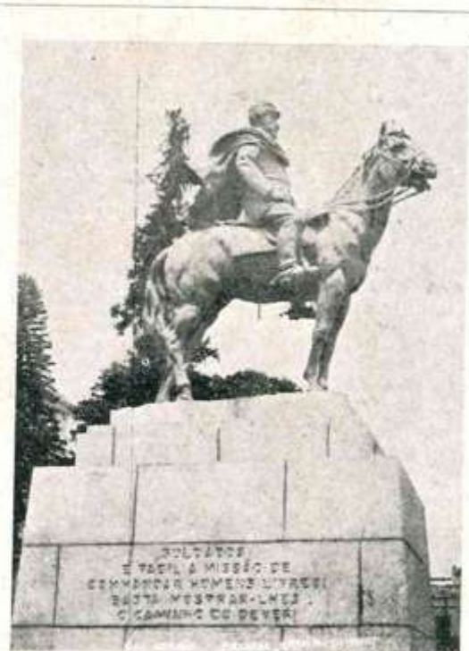
Monumento ao General Osorio — herói da campanha do Paraguai.