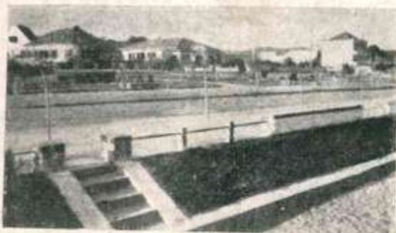
Panorama da aristocratica Praia da Assunção, nos arredores de Porto Alegre, destacando-se a bela edificação de bungalows.