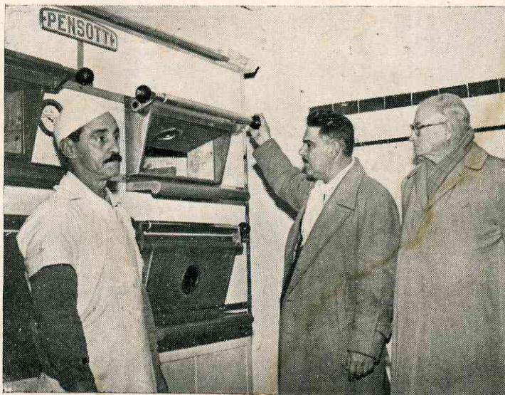
Dr. Paulo Couto, Prefeito de São Leopoldo, examinando um dos fornos.

Na padaria é confeccionado pão com peso exato, sendo o preço por Kg, Cr$ 12,00, 1/2 Kg. Cr$ 6,00, produzindo, ainda, a mesma, biscoitos, tortas e doces, para serem vendidos com preços módicos à população trabalhadora.